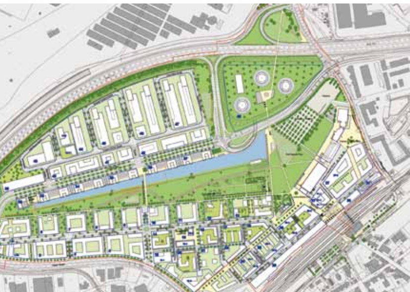
Hin zur elektromobilen Stadt, Zweckverband Flugfeld Böblingen/Sindelfingen