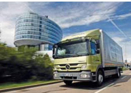
Mercedes-Benz Atego BlueTec Hybrid, Daimler AG