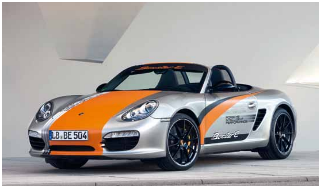
Porsche Boxster E, Dr. Ing. h. c. F. Porsche AG

Zu den Projektpartnern gehören Global Player, mittelständische Firmen und Unternehmensgründer. Zahlreiche Organisationen, Hochschulen und Forschungseinrichtungen unterstützen das Konzept ebenso wie Städte und Gemeinden. Die folgenden Listen sind Momentaufnahmen, die kontinuierlich fortgeschrieben werden.