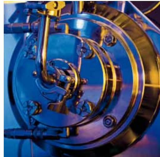
Kugelmühle am Institut für Werkstoffprozesstechnik (IAM-WPT), KIT