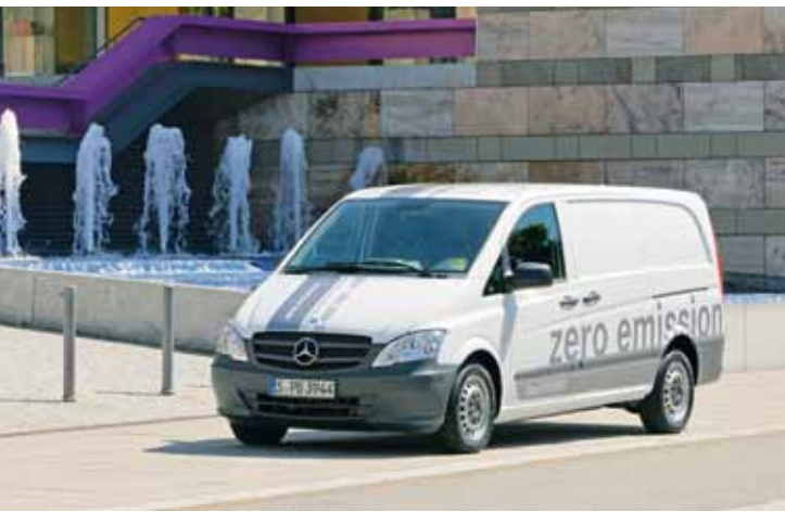
Vito E-CELL, Daimler AG