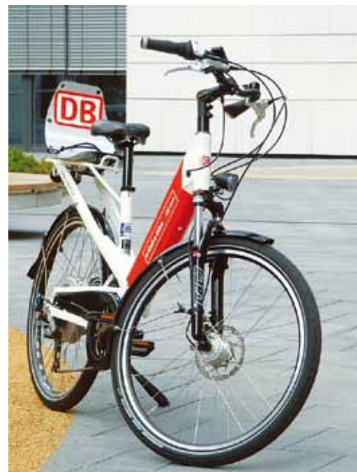
Call a Bike, Landeshauptstadt Stuttgart