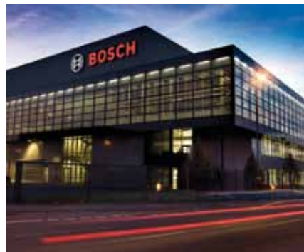
Robert Bosch Zentrum für Leistungselektronik