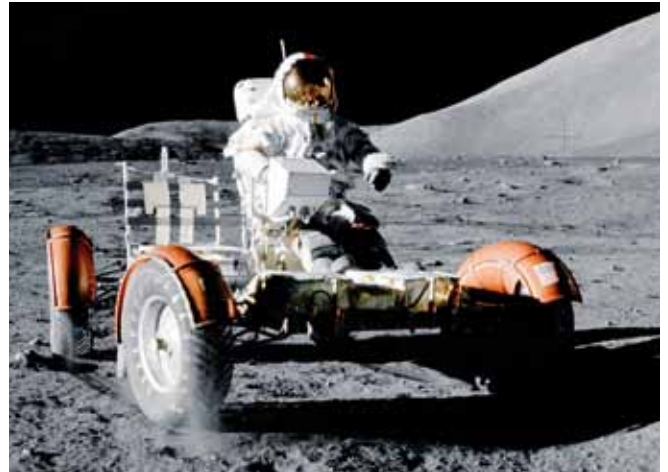
Apollo-17-Mission am 11.12.1972, NASA