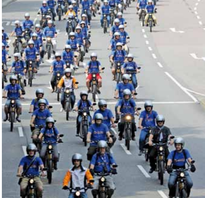
ELMOTO-Flotte am 4. Juli 2010, EnBW AG