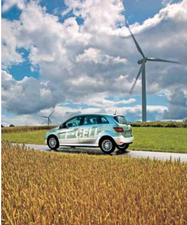
Mercedes-Benz B-Klasse F-CELL, Daimler AG