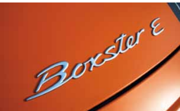
Porsche Boxster E, Dr. Ing. h.c. F. Porsche AG