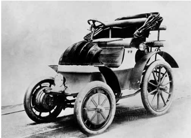
Lohner-Porsche, Dr. Ing. h. c. F. Porsche AG

Höchsten Ruhm erntete diese zukunftsweisende Erfindung auch später im Zeitalter der Weltraumfahrt. Die NASA nutzte die Idee des elektrischen Radnabenmotors, um ihr Mondfahrzeug damit zum Rollen zu bringen.