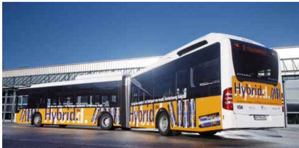
Citaro Dieselhybridbus, SSB AG

Der 18 Meter lange Mercedes-Benz Gelenkbus Citaro G BlueTec-Hybrid erlaubt das völlig abgasfreie Fahren auf Teilstrecken, den leisen und praktisch ruckfreien Antrieb – das einzigartige Fahrzeugkonzept mit vier elektrischen Radnabenmotoren sowie einer der weltweit größten Lithium-Ionen-Batterien im Fahrzeugeinsatz. Diese Batterie speichert die Energie aus dem Dieselgenerator und die beim Bremsen zurückgewonnene elektrische Energie. Somit wird der ohnehin schon niedrige Dieselverbrauch um bis zu 30 Prozent und im gleichen Maß der CO 2 -Ausstoß reduziert.