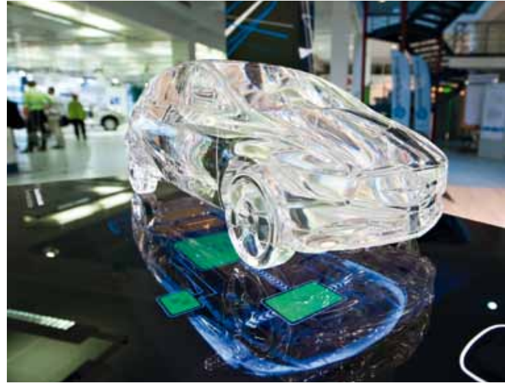
Zentrum für E-Mobilität