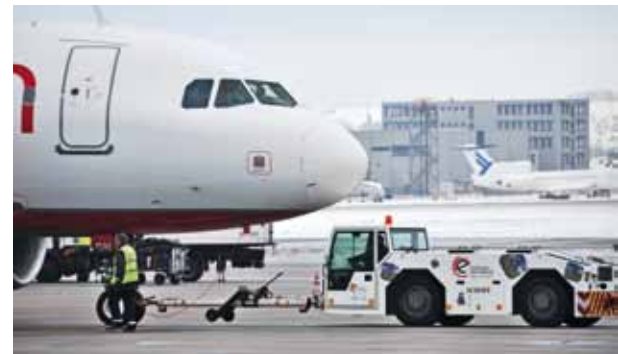
F110 „electric“, Schopf Maschinenbau GmbH