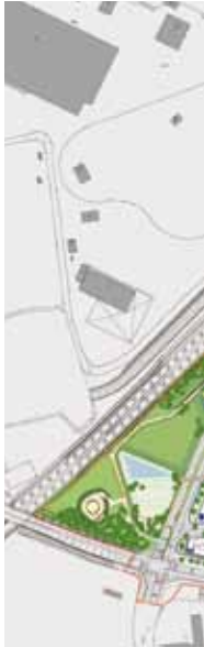
Elektromobilität vernetzt nachhaltig, Stadt Ludwigsburg